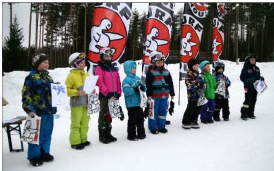
Julged lastest lumelaudurid, kes esinesid Valgehobusemäe rodeol.

Samal ajal, kui suusaradadel hakkasid selguma parimad, toimusid lumelauamäel Valgehobusemäe Rodeo võistlused, kus osales seekord kaks korda rohkem osalejaid kui aasta tagasi. Kokku oli võistlejaid üle terve Eesti 34 kuues võistlusklassis.